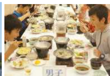
楽しいホテルでの宿泊 美味しい夕食のひとつも すてきな思い出になりました