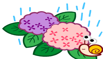
あじさい読書週間