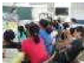
真剣な眼差しで読み聞かせを楽しむ